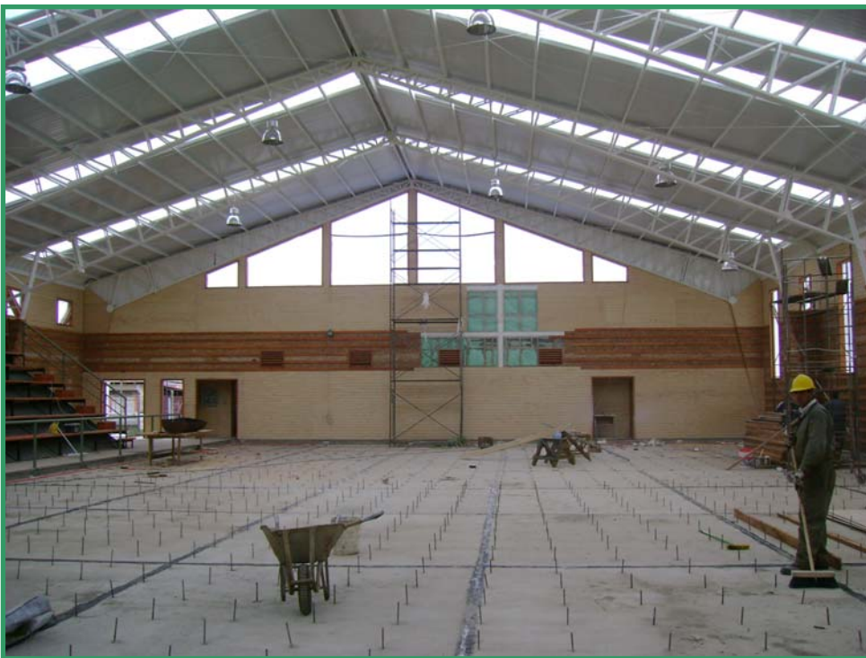
Moro poniente donde ira el tablero