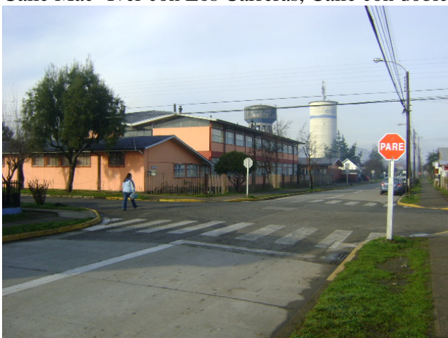
Calle Mac Iver con C. Henriquez