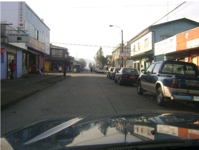
Calle Balmaceda con C. Henrriquez