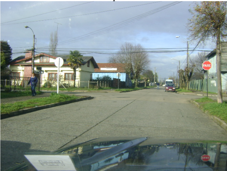
Calle V. Mackenna con F. Bilbao