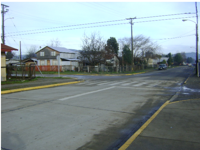
Calle Mac- Iver con Los Carreras, Calle con doble sentido