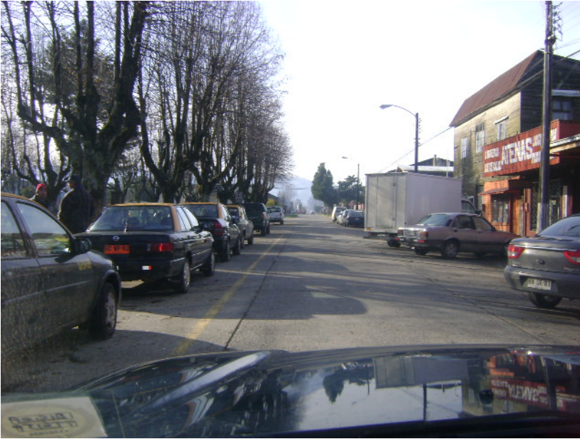
Esta fotografia muestra el estacionamiento diagonal el cual no debería estar.