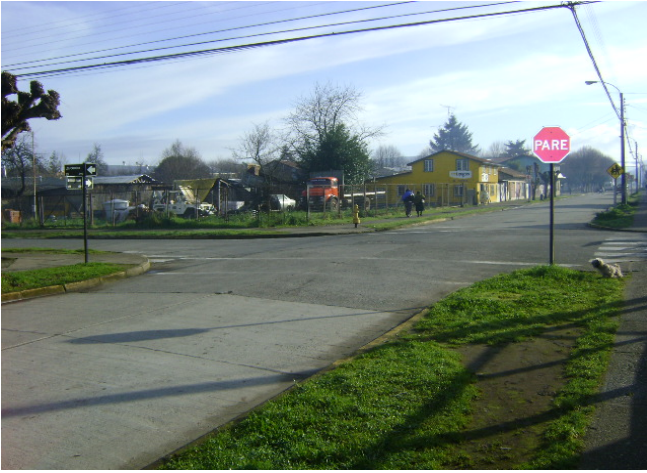
Calle Los Carreras con A. Prat