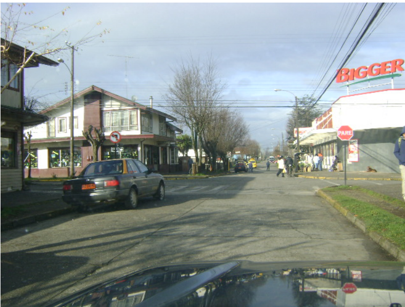
Calle Prat con Camilo Henrriquez