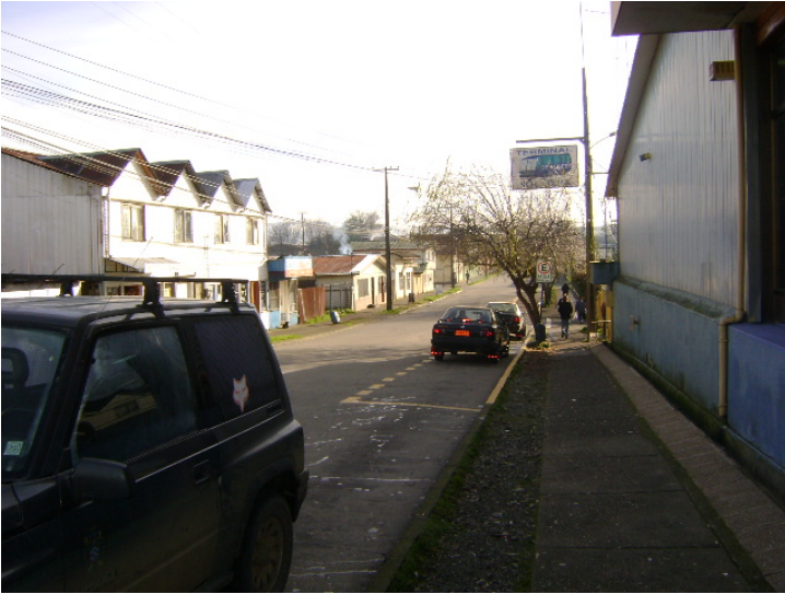
Calle A. Prat y Los Carreras