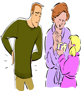
Padre, madre e hija 12.300 puntos FPS