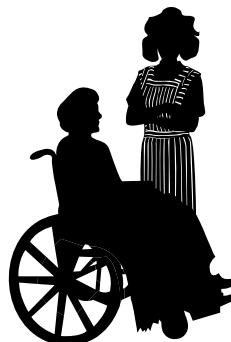
Mujer jefa de familia con discapacitado no autovalente 5.400 puntos FPS