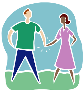
Pareja de jóvenes sin hijos 12.800 puntos FPS