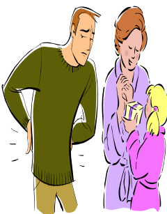
Padre, madre e hija mayor de 2 años 11.700 puntos FPS