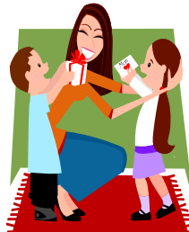
Mujer jefa de familia sola con dos hijos 8.300 puntos FPS