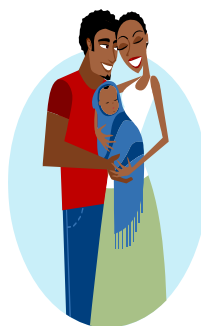
Padre, madre e hija menor de 2 años 8.700 puntos FPS