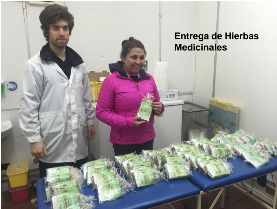
Entrega de Hierbas Medicinales