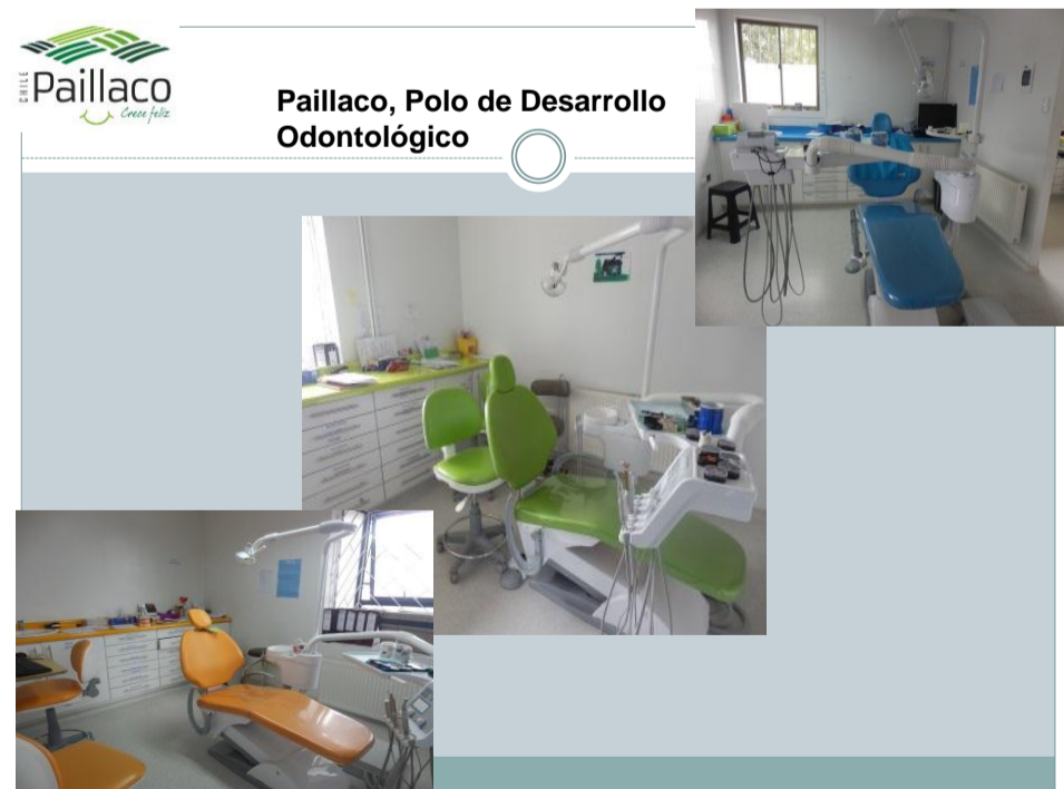
Paillaco, Polo de Desarrollo Odontológico