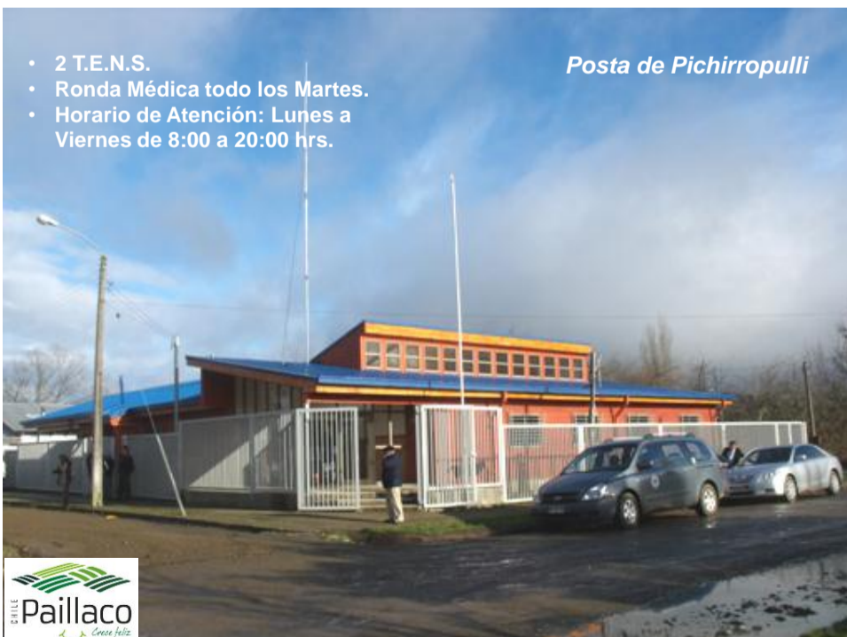
Posta de Pichirropulli