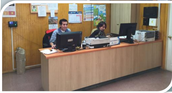
Venta de Bonos FONASA