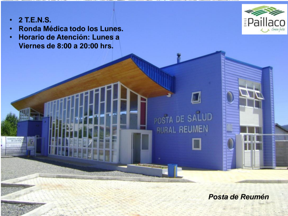
Posta de Reumén